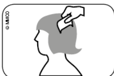
Abb. Durchkämmen des nassen Haares mit Läusekamm vom Haaransatz bis zu den Haarspitzen